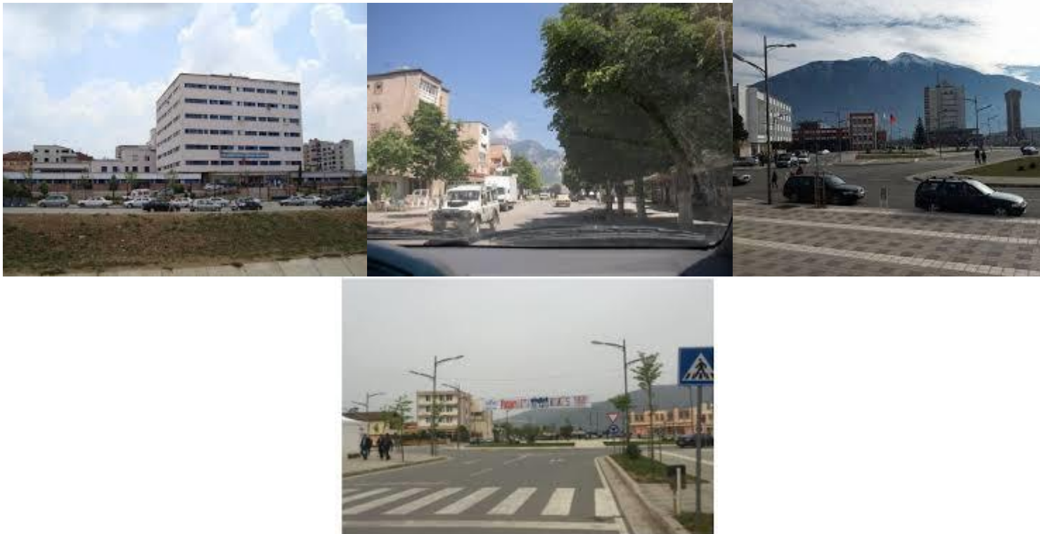
Foto nga Kukesi