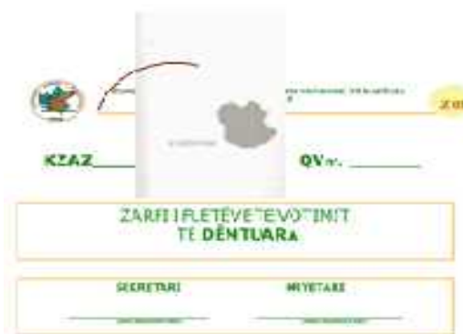
Zarfi Z.02: ZARFI I FLETËVE TË VOTIMIT TË PAPËRDORURA