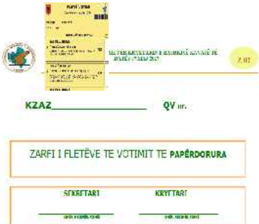
Zarfi Z.02: ZARFI I FLETËVE TË VOTIMIT TË PAPËRDORURA"

Model i miratuar me Vendim të KQZ-së Nr 111, datë 29.03.2017