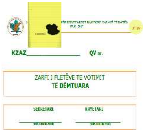
Zarfi Z.03: "FLETË VOTIMI TË DËMTUARA",

Për çdo sqarim, lidhur me procedurën e mbylljes së votimit, referohuni Manualit të KQV-së (fq. 39 e në vijim).