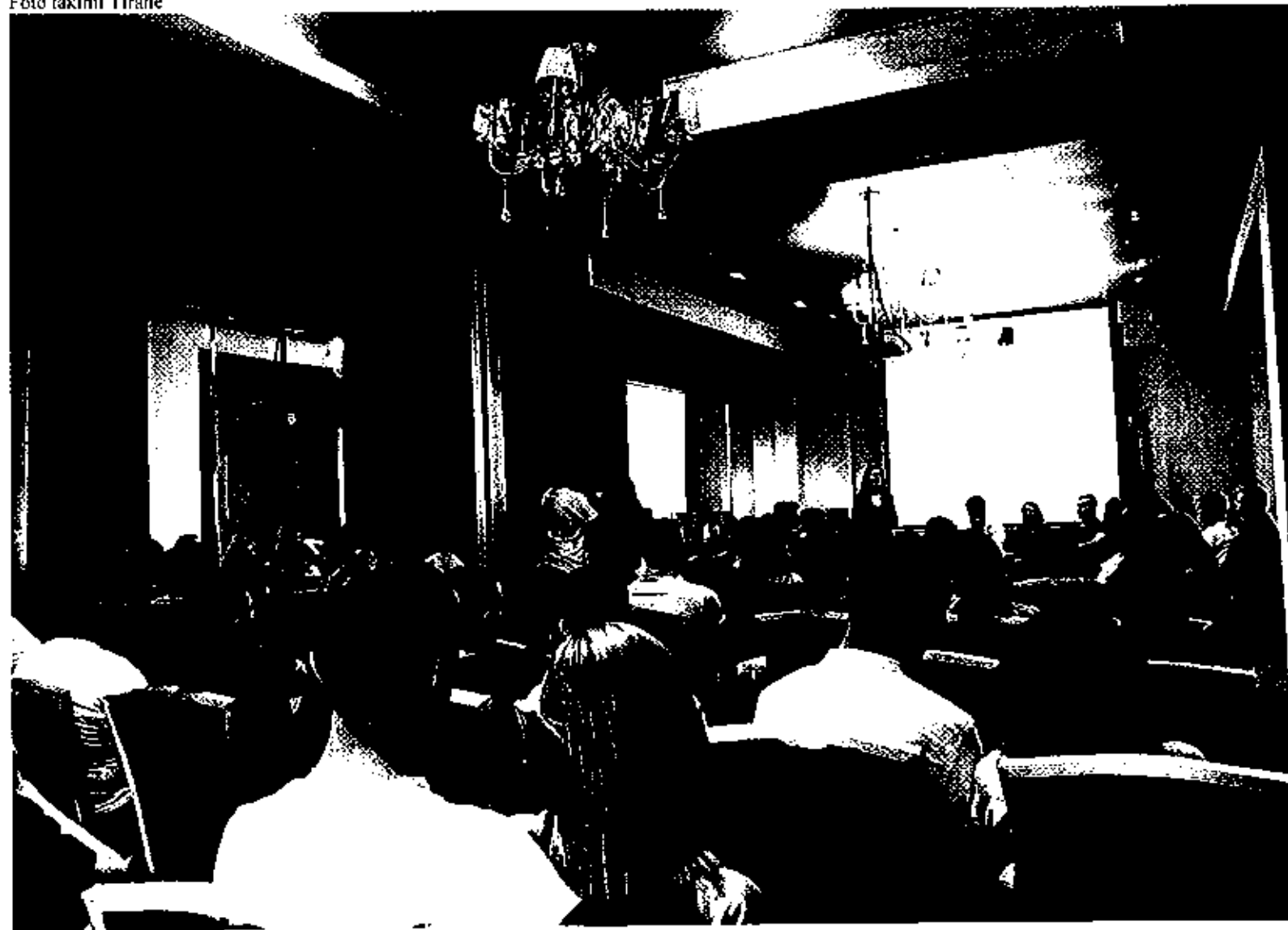
Foto takimi Tiranë