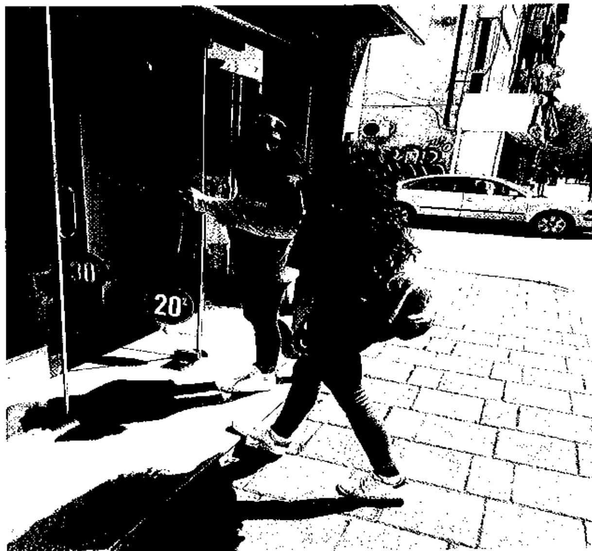
Foto fushata në Tiranë